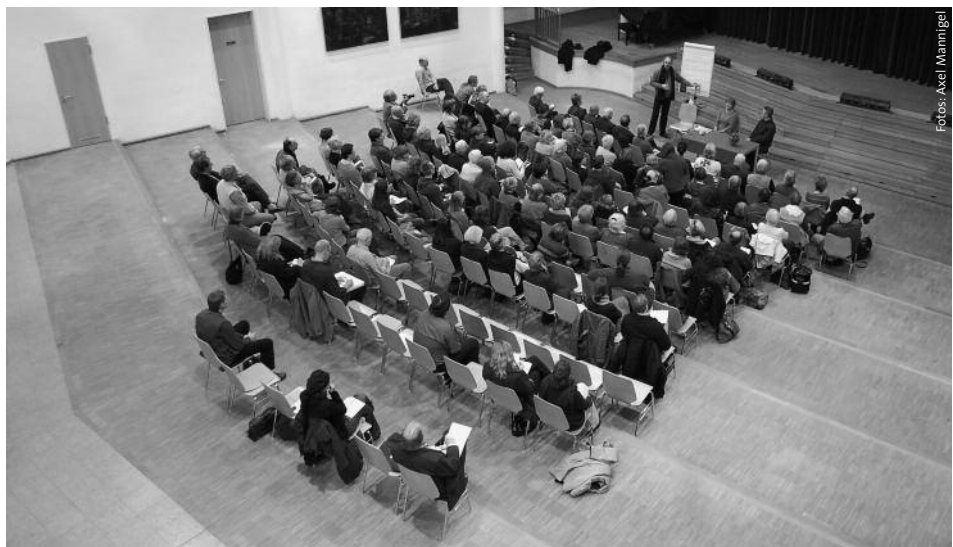
Ein Thema, unterschiedliche Methoden: Plenum

Am 6. und 7. November fand in der Blote-Vogel-Schule in Witten-Annem ein von der Anthroposophischen Gesellschaft in Nordrhein-Westfalen (DE) und der Kulturgemeinschaft Fakt 21 veranstalteter Thementag zu Karmaforschung und Karmapaxis statt. Rund 120 Teilnehmende erlebten in Kurzbeiträgen, Plena und Arbeitsgruppen die Wichtigkeit und praktische Notwendigkeit eines der Zentralthemen Rudolf Steiners.