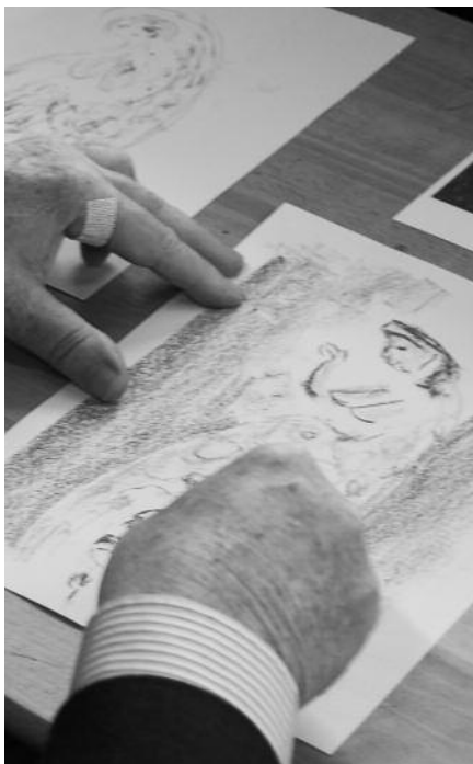
Wahrnehmungsschulung als Arbeitsvoraussetzung: Kreativitätsübung in einer Arbeitsgruppe

Um für dieses Hinschauen, Wahrnehmen und Verstehen die geeigneten Grundlagen zu schaffen, ist innere Schulung, so der Eindruck, unumgänglich. Die Referentinnen und Referenten bezogen sich dabei maßgeblich auf das Werk Rudolf Steiners, das sie ganz praktisch als Ausgangspunkt für ihre Arbeit nehmen. Die jeweiligen methodischen Ansätze, das haben die zwei Plena gezeigt, sind dabei jedoch so unterschiedlich, wie es der Sache angemessen ist.